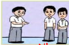
أنتم طلاب مجتهدون