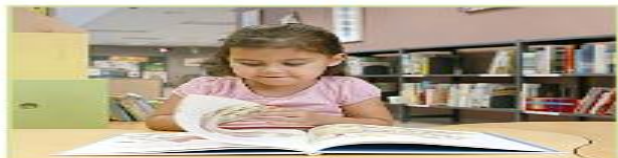
هي تقرأ القصة