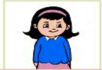
أنتِ فتاة رائعة