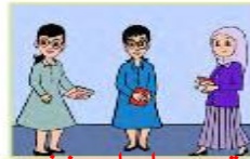
أنتن معلمات نشيطات