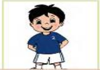
أنتَ طفل جميل

3. أكمل الجمل الآتية بضمير خطاب مناسب ( أنت . أنت . أنتما . أنتم . أنتن ) يعبر عن الصورة: