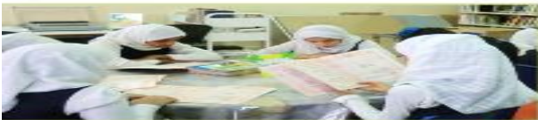
هن يقرأن القصص

2. أعبر عن الصور الآتية بجمل مفيدة باستخدام ضمائر الغائب ( هو . هي . هم . هن ) :