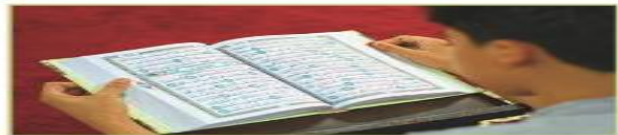
هو يقرأ القرآن