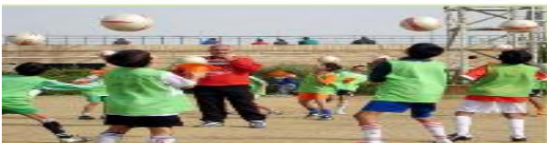
هم يلعبون بالكرة