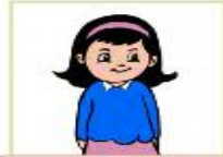
أنتِ فتاة رائعة