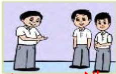
أنتم طلاب مجتهدون