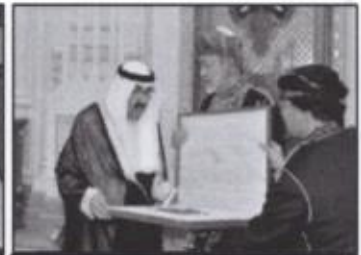
وسام آل سعيد ص ٤٦

وزارة التربية التوجيه الفني العام للاجتماعيات