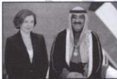
وسام قائد جوقة الشرف ص ٤٥

( وسام قائد جوقة الشرف - وسام زايد - وسام الدولة - وسام آل سعيد )