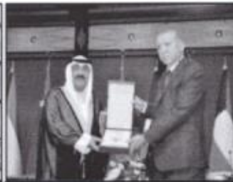
وسام الدولة ص ٤٧