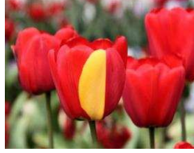
بورقة صفراء، بسبب حدوث طفرات في جيناتها

يمكن تصنيف الطفرات وفقاً لمسبباتها (تلقائية-محدثة)، من حيث قابلية توريثها (جسدية-جنسية)، أو فقدان-كسب وظيفة)، أو بأثرها (ضارة-نافعة-محايدة)، أو الوظيفة حسب تأثيراتها على الصلاحية . على تسلسلات البروتينات، أو بآليات حدوثها في الدنا والكروموسومات