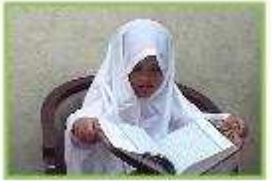
هذه فتاة تقرأ القرآن