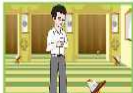
هذا ولد يصلي