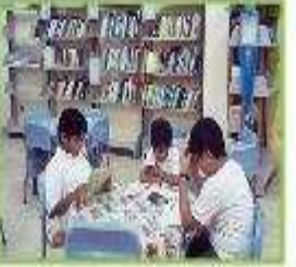
هؤلاء طلاب مجتهدون