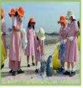
هؤلاء متطوعات مبدعات