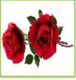
هاتان وردتان رائعتان