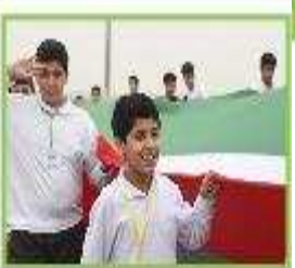
هذان طالبان يرفعان العلم