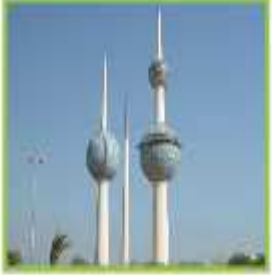
هذه أبراج الكويت