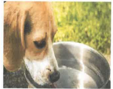
إناء ولغ فيه الكلب

الغسل سبع مرات اولاهن بالتراب / الغسل بالماء / الدلك بالتراب ص ٤٨