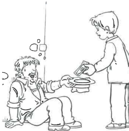
عبادة مالية ص ٨٢