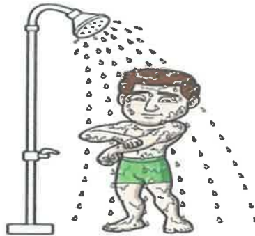
نجاسة في بدنه