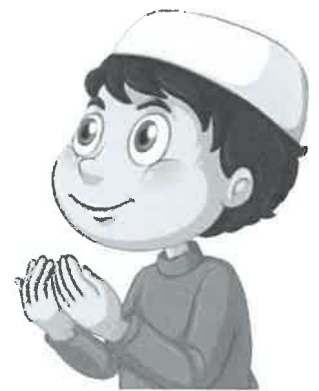
عبادة قولية ص ٨١