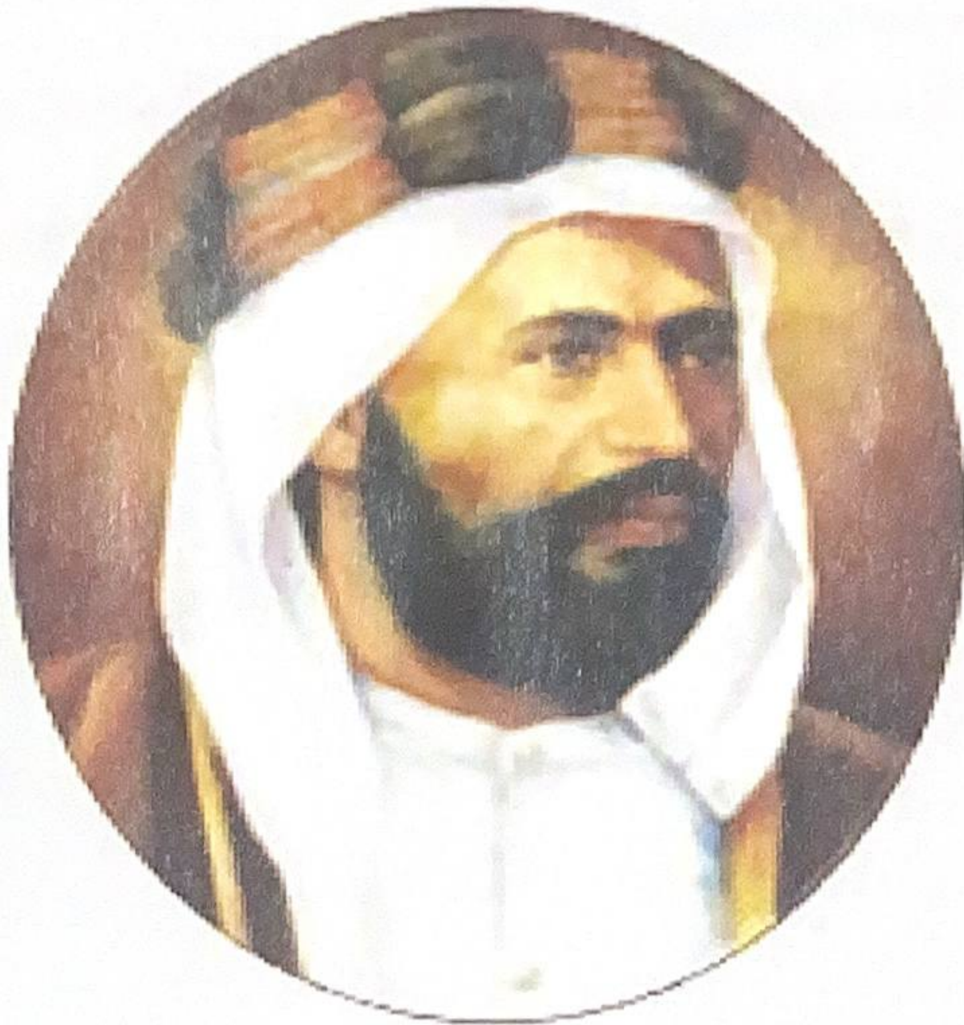
شكل رقم (١٩)

كانت الفترة القصيرة التي تولى فيها الشيخ جابر المبارك، والتي عاصرت حدثًا تاريخيًا كبيرًا ألا وهو الحرب العالمية الأولى (١٩١٤-١٩١٨) م بكل ما فيها من أحداث، تُعدُّ فترة دقيقة على كافة الأصعدة، ومختلف الاتجاهات، خاصة أن أي تحول جذري أو خطوة غير محسوبة في علاقة الكويت بالقوى الموجودة، كانت محفوفة بالمخاطر، ولها تبعاتها لا على الكويت فحسب، بل على السلطة ذاتها، حيث كان من الواضح أن الشيخ جابرًا