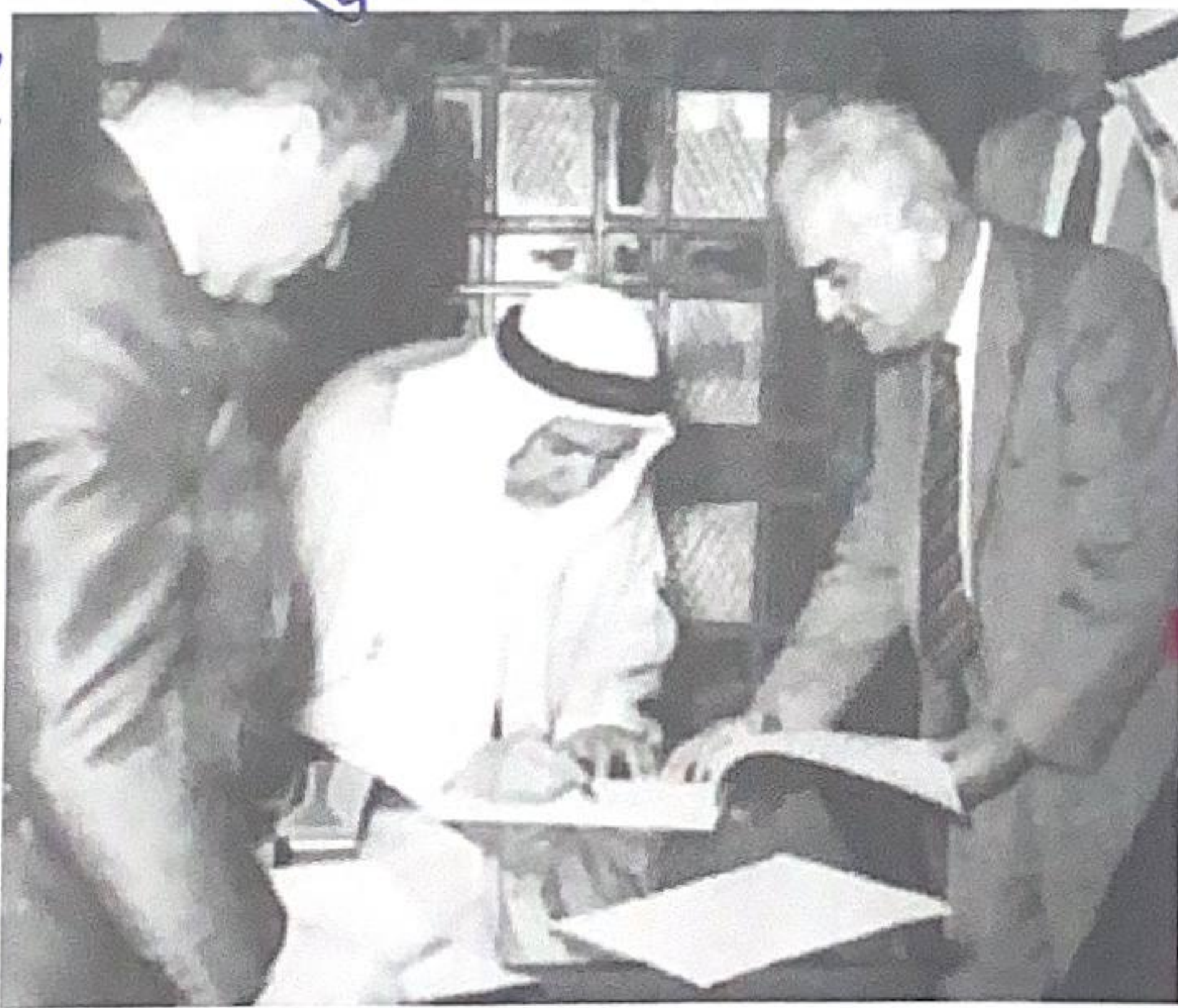
شكل رقم (٢٣)

الداعم لمطالب حاكم العراق آنذاك رئيس الوزراء العراقي عبدالكريم قاسم.