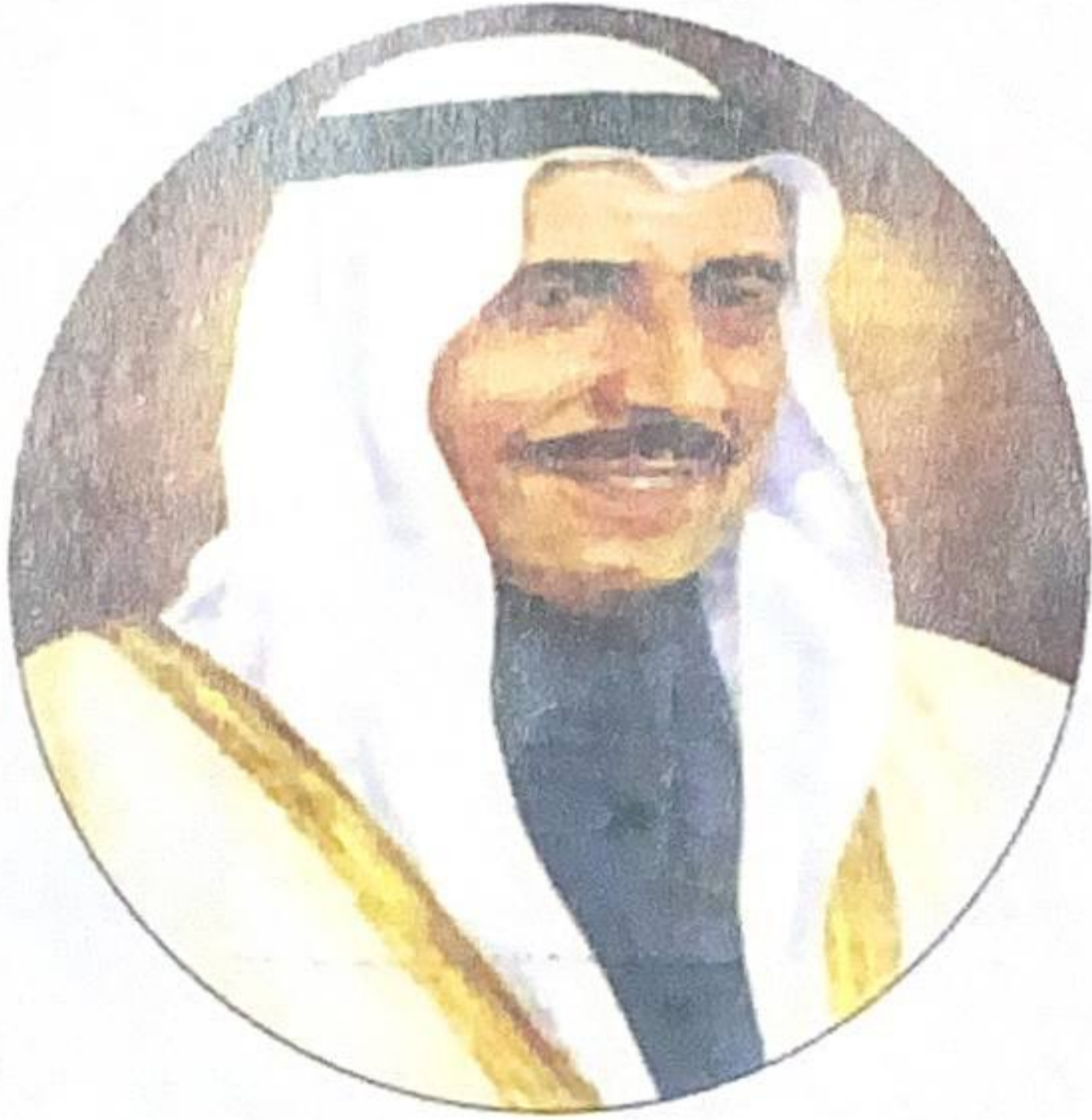
شكل رقم (٢٤)

يعتبر الشيخ صباح السالم أول ولي للعهد في تاريخ دولة الكويت، حيث عين في هذا المنصب بموجب مرسوم أميري صدر في ٣٠ أكتوبر ١٩٦٢م، وهو الحاكم الثاني بعد استقلال دولة الكويت.