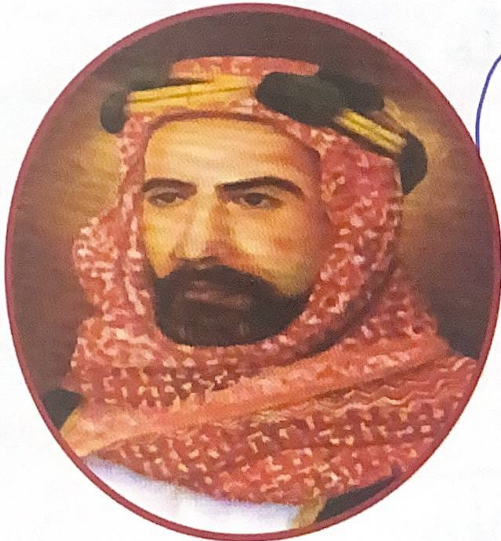
شكل رقم (٢٠)

• الشيخ سالم بن مبارك الصباح (١٩١٧م - ١٩٢١م)