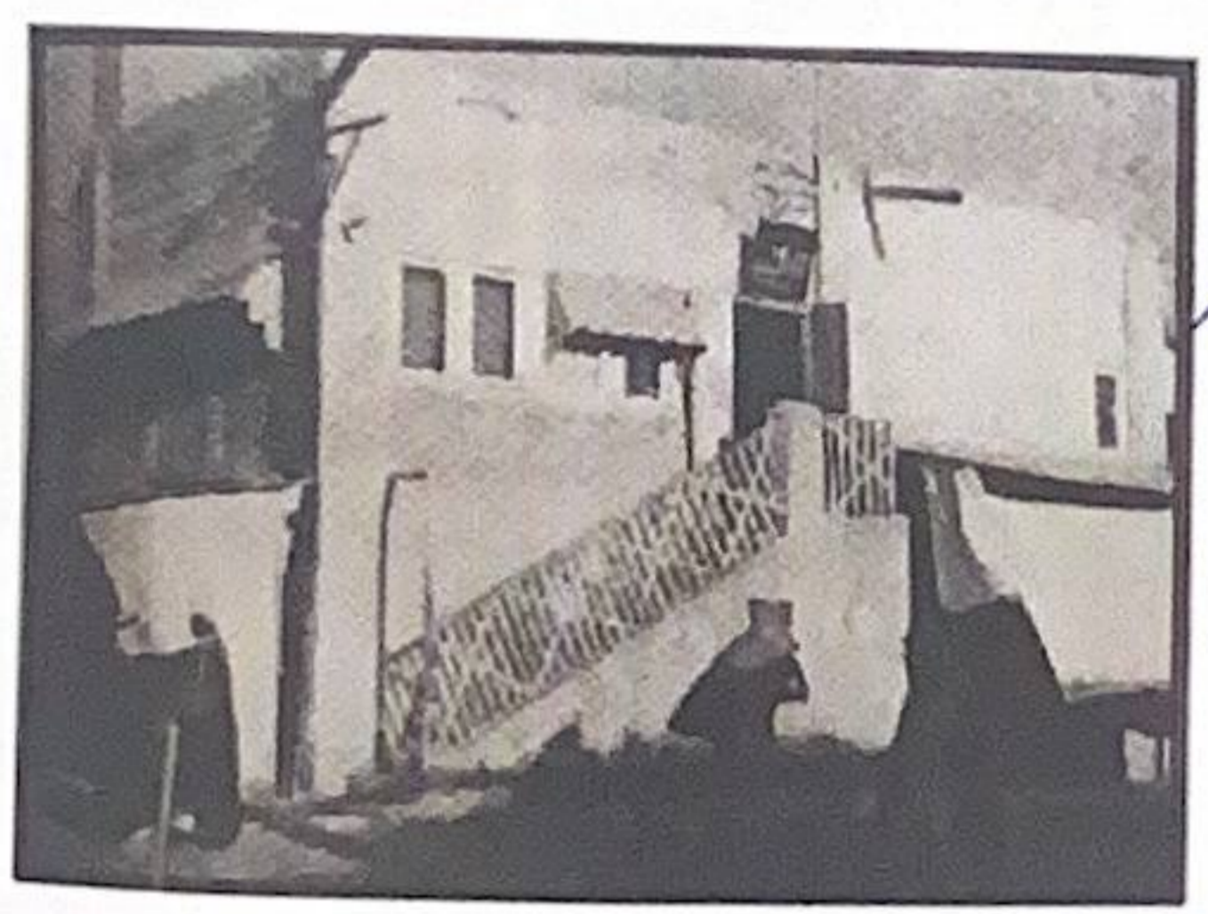
المقر القديم لبلدية الكويت قبل هدمه، والمعروف بـ «الكشك الجنوبي».

وافق الشيخ أحمد الجابر - رحمه الله - في ١٤ ذي القعدة ١٣٤٨ الموافق ١٣ إبريل ١٩٣٠م على إنشاء بلدية الكويت لتسهم في مسؤولية النهوض بالبلاد بمختلف المجالات الصحية والاجتماعية، ولتمارس نشاطها من خلال مجلس بلدى منتخب يرفع مصالح المواطنين.