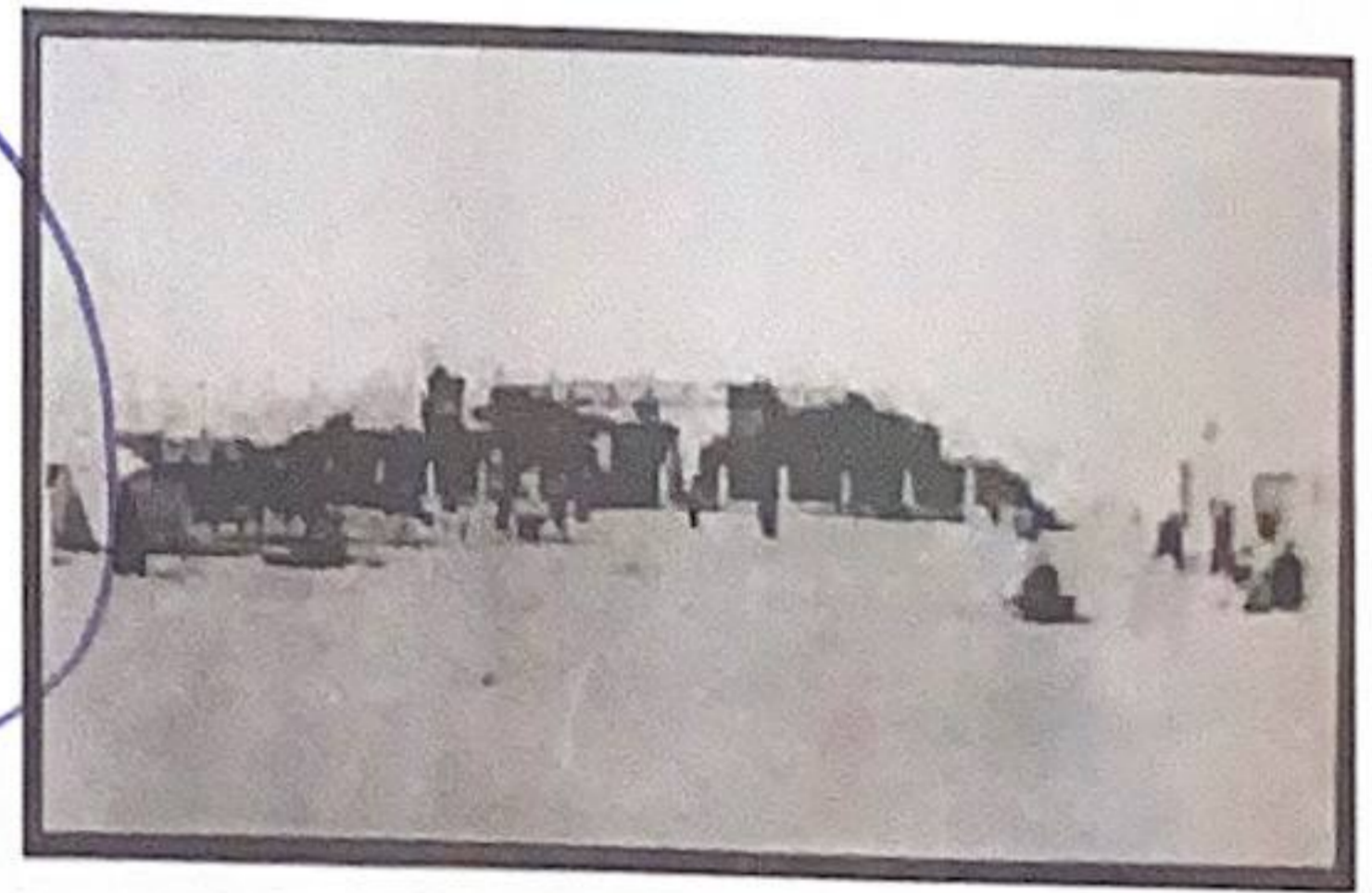
أول موقع لبلدية الكويت، عبارة عن خيمة عام ١٩٣٠

إن فكرة البلدية هي امتداد لولاية الحسبة المعروفة في تاريخ المسلمين، فمهام البلدية لا تختلف عن