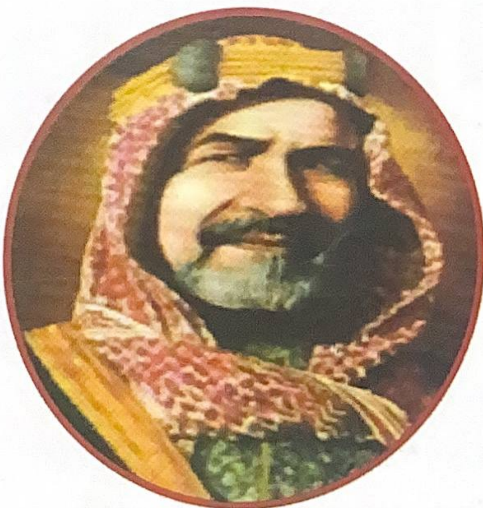
شكل رقم (٢١)

علل: كان الشيخ أحمد حذراً في التعامل مع بريطانيا