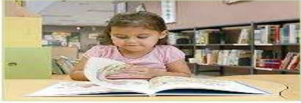
هي تقرأ القصة