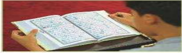
هو يقرأ القرآن الكريم