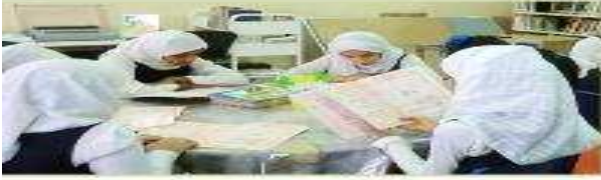
هـن يقرآن القصص