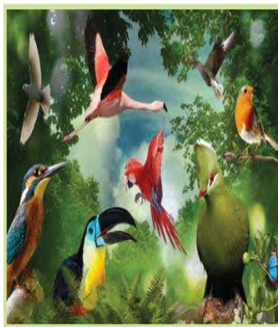
هذه طيور جميلة وملونة

- أكتب جملة من إنشائي تعبر عن الصورة الآتية ، حوت إحدى كلماتها الحرف ( ط ) ، مستخدما خط النسخ