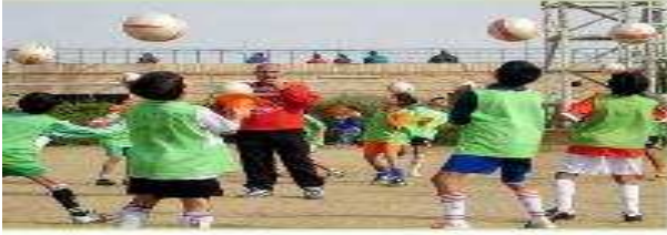
هم يلعبون بالكرة