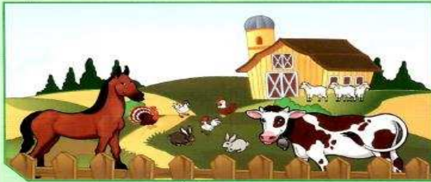
بيئة رقم (2)

أمامك بيئتان قام الإنسان ببنائهما. حدّد منهما المطلوب في الجدول.