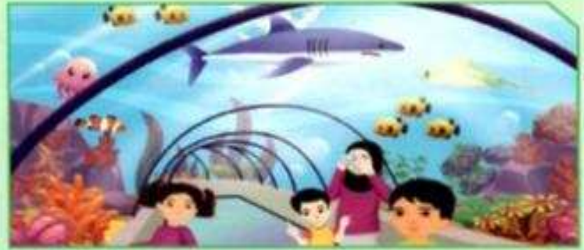
بيئة رقم (1)