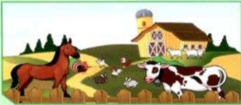
بيئة رقم (2)

أمامك بيئتان قام الإنسان بينائهما. حدّد منهما المطلوب في الجدول.