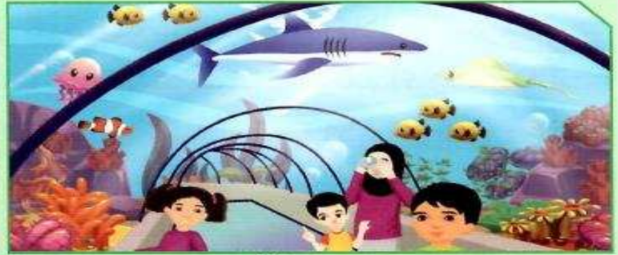
بيئة رقم (1)