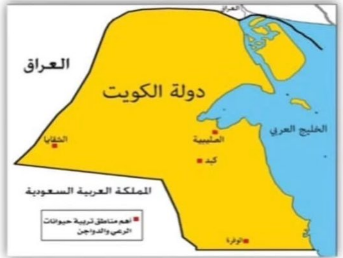
مناطق تربية حيوانات الرعي والدواجن