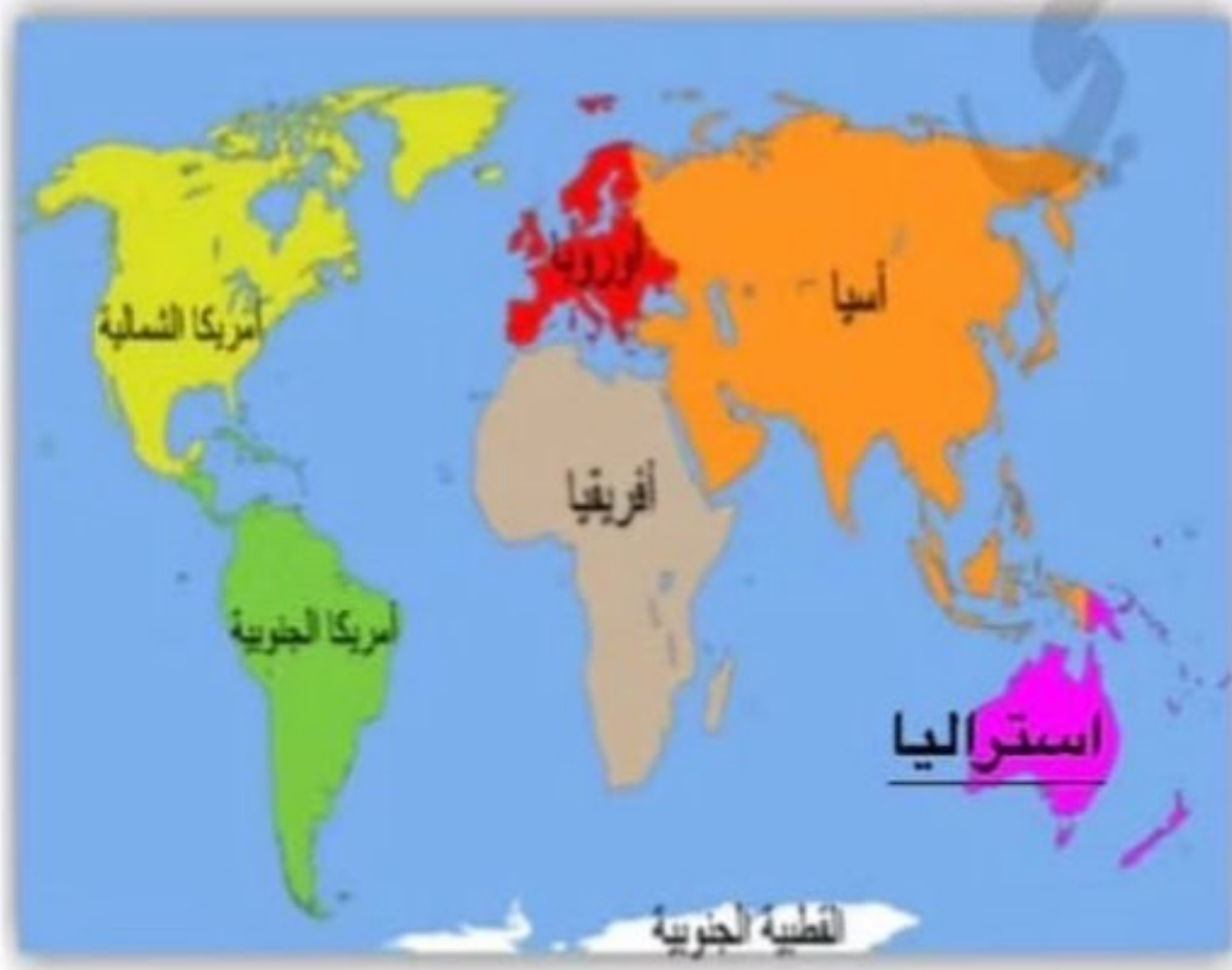
قارات العالم ( سبع قارات )